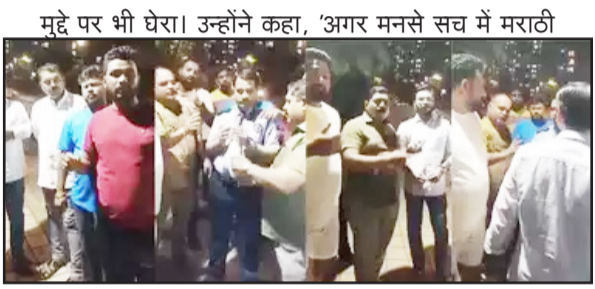
मुद्दे पर भी घेरा। उन्होंने कहा, 'अगर मनसे सच में मराठी

बयानबाजी का दौर तेज हो गया है। शिवसेना (उद्धव गुट) के वरिष्ठ नेता संजय निरुपम ने महाराष्ट्र नवनिर्माण सेना (मनसे) पर तंज कसते हुए कहा कि राज ठाकरे को 'मराठी लर्निंग क्लासेस' शुरू करनी चाहिए। उन्होंने भाजपा को भी सलाह दी कि वह मनसे पर अधिक भरोसा न करे, क्योंकि राज ठाकरे कब अपना समर्थन वापस ले लेंगे, इसका कोई भरोसा नहीं। निरुपम ने मनसे को मराठी भाषा और मराठी मानुस के