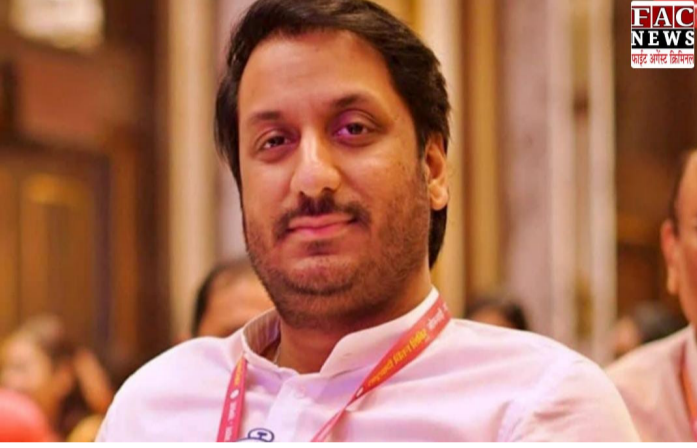
जांच समिति ने इस मामले में पार्थ पवार को 'प्रतिरक्षा' प्रदान की है। ऐसा माना जाता है कि जमीन की

में एक जांच समिति का गठन किया था। पार्थ पवार को राहत