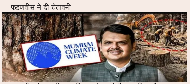
फडणवीस ने कहा कि अत्यधिक वर्षा, लू, बेमौसम बारिश और अन्य चरम मौसमी घटनाओं का प्रभाव तटीय शहरों पर स्पष्ट रूप से दिखाई दे रहा है। उन्होंने कहा कि जलवायु परिवर्तन अब केवल पर्यावरणीय मुद्दा नहीं, बल्कि

फडणवीस ने जलवायु परिवर्तन को शासन की बड़ी चुनौती बताया। उन्होंने 2030 तक महाराष्ट्र में 50% हरित ऊर्जा का लक्ष्य रखा और तटीय शहरों के लिए आपदा-रोधी बुनियादी ढांचे पर जोर दिया। महाराष्ट्र के मुख्यमंत्री देवेंद्र फडणवीस ने जलवायु परिवर्तन को एक तत्काल शासन संबंधी चुनौती बताते हुए कहा कि मुंबई जैसे तटीय शहर अब चरम मौसमीय घटनाओं के सीधे प्रभाव का सामना कर रहे हैं। उन्होंने जलवायु संकट से निपटने के लिए मजबूत कार्यान्वयन, निवेश और वैश्विक साझेदारियों की आवश्यकता पर जोर दिया। मुख्यमंत्री मंगलवार को 'मुंबई क्लाइमेट वीक' (एमसीडब्ल्यू) के उद्घाटन अवसर पर बोल रहे थे। तीन दिवसीय इस कार्यक्रम में संगोष्ठियों, कार्यशालाओं, केस स्टडी और विचार-विमर्श सत्रों का आयोजन किया गया है।